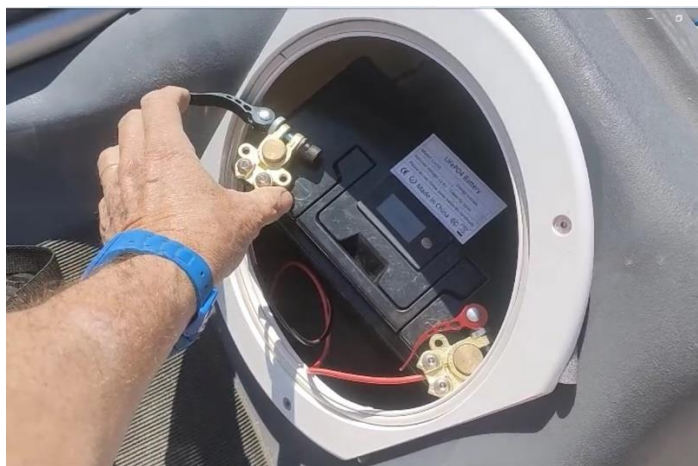
Branchements de la batterie