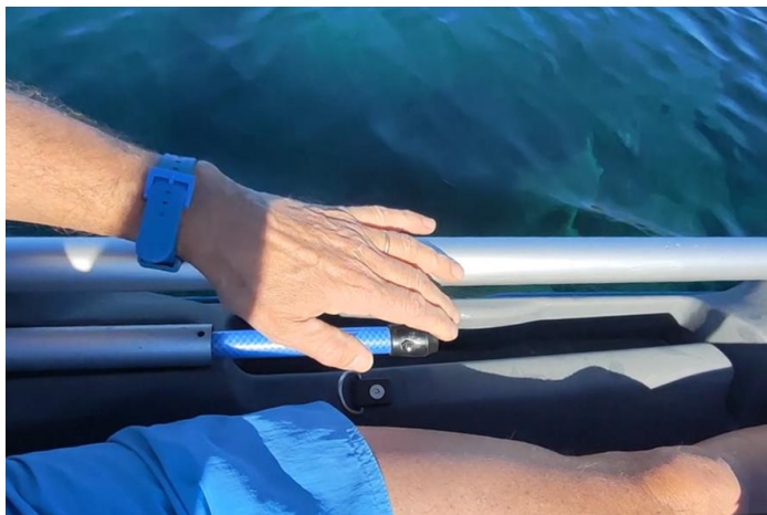
Stick de commande de direction